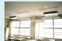
教室空調イメージ