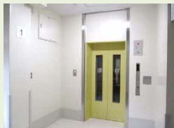
エレベーターイメージ