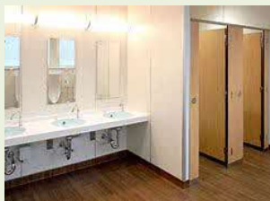
トイレ改修イメージ