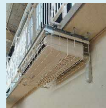
体育館空調(さだ中学校) (R6.2.1 供用開始)