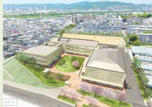
禁野小学校 新校舎イメージ